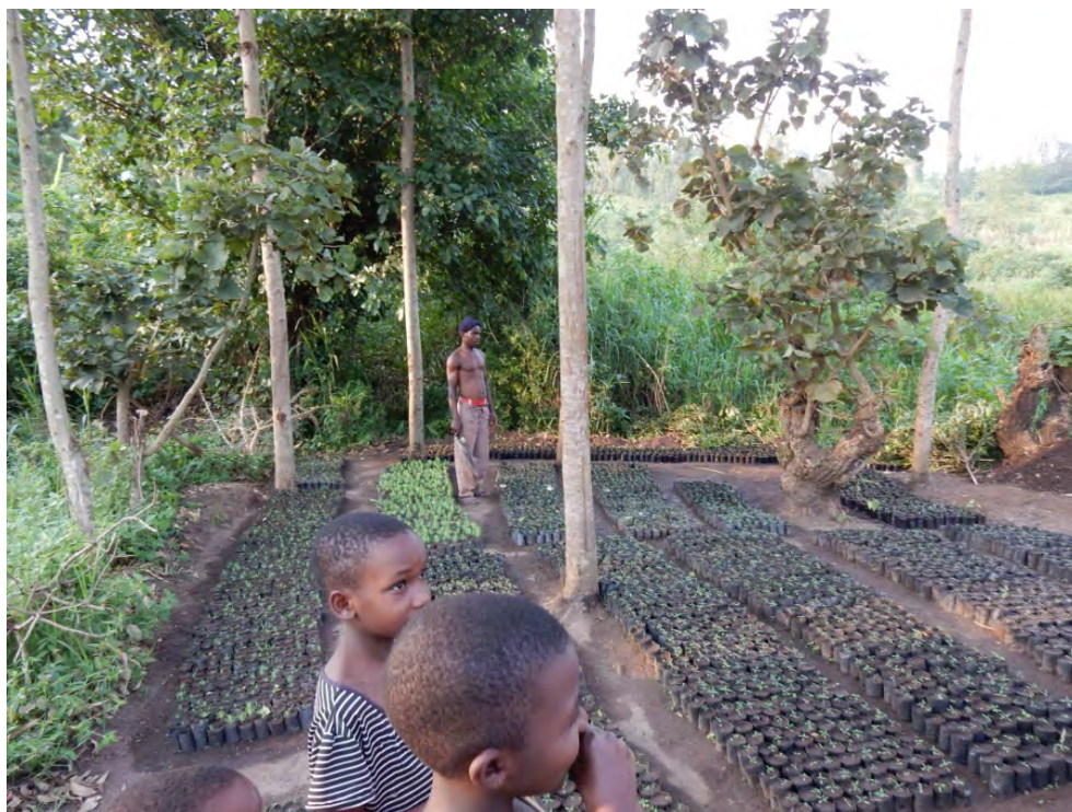
Een van de 6 kwekers van Gepat